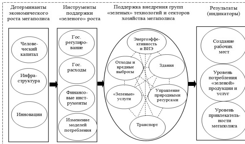
Рис. 3. Модель политики «зеленого» роста мегаполиса