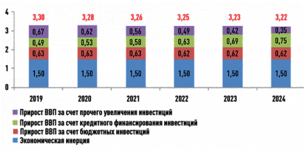
Рисунок 2. Темпы роста ВВП в 2019–2024 гг., %

Однако любой процесс имеет пределы. Снижение доли базовой промышленности в структуре формирования ВВП негативно влияет как на уровень занятости населения, так и на его доходы. Доля доходов, находящихся в распоряжении транснациональных корпораций, становится неприемлемой даже для развитых стран. В этих условиях современная реиндустриализация развитых стран стала одним из ключевых элементов современной экономической повестки.