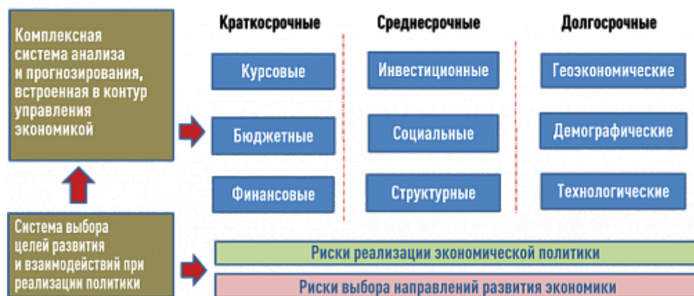
Рисунок 3. Возможная конфигурация системы прогнозирования и оценки рисков экономического развития

В то же время понятно, что риски формирования и реализации экономической политики через набор таких проектов существуют и они достаточно высоки. Прежде всего они связаны с тем, что средства будут потрачены с достаточно низким макроэкономическим эффектом, а усилия государства не будут поддержаны частным сектором. В связи с этим возникает крайне актуальная задача оценки макроэкономической эффективности национальных проектов как в отдельности, так и с учетом их совокупного влияния на экономическую динамику. Такая работа требует расширения методов макроструктурного анализа и прогнозирования, обеспечивающих взаимную увязку механизмов финансирования отдельных проектов и их отраслевую специфику с ключевыми параметрами регулярной экономической политики и фактической структурой отечественной экономики.