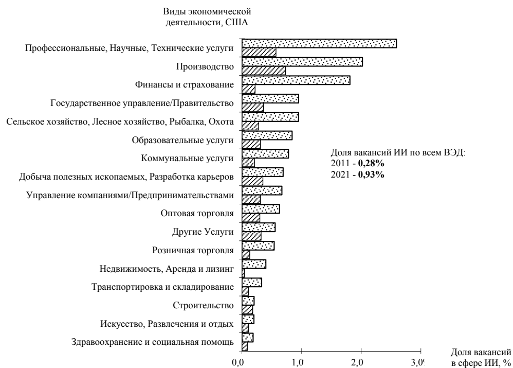
Рис. 1. Доля вакансий в сфере ИИ по отношению к общему числу вакансий в ВЭД, в США в 2011 (■) и 2021 (□) гг.

Расчет прогнозной кадровой потребности. Ключевым показателем, характеризующим ИИ-рынок труда США, служат данные о доле вакантных рабочих мест в сфере искусственного интеллекта в общем числе вакансий по видам экономической деятельности. На рис. 1 приведены данные о доле вакансий в сфере ИИ в США в 2011 и 2021 гг. 14 в разрезе видов экономической деятельности.