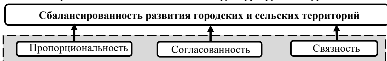
Рис.1 – Условия обеспечения сбалансированности развития городских и сельских территорий как структурно-функциональных элементов пространства региона

Эти условия являются необходимыми, но в то же время недостаточными для обеспечения сбалансированности развития городских и сельских территорий, поскольку не учитывают объективно существующие и потенциальные связи между ними. В связи с этим с опорой на теории региональной и пространственной экономики («центр-периферия» Дж. Фридмана, диффузии инноваций Т. Хегерстранда, сельскохозяйственного штандорта Й.Г. фон Тюнена и иных) предложено третье условие сбалансированности – связность, которая заключается в формировании устойчивых (сохраняющихся длительный период), интенсивных, паритетных (взаимовыгодных) связей между городом и селом (рис. 1). При этом возникают производственные, социальные, инфраструктурные и другие связи.