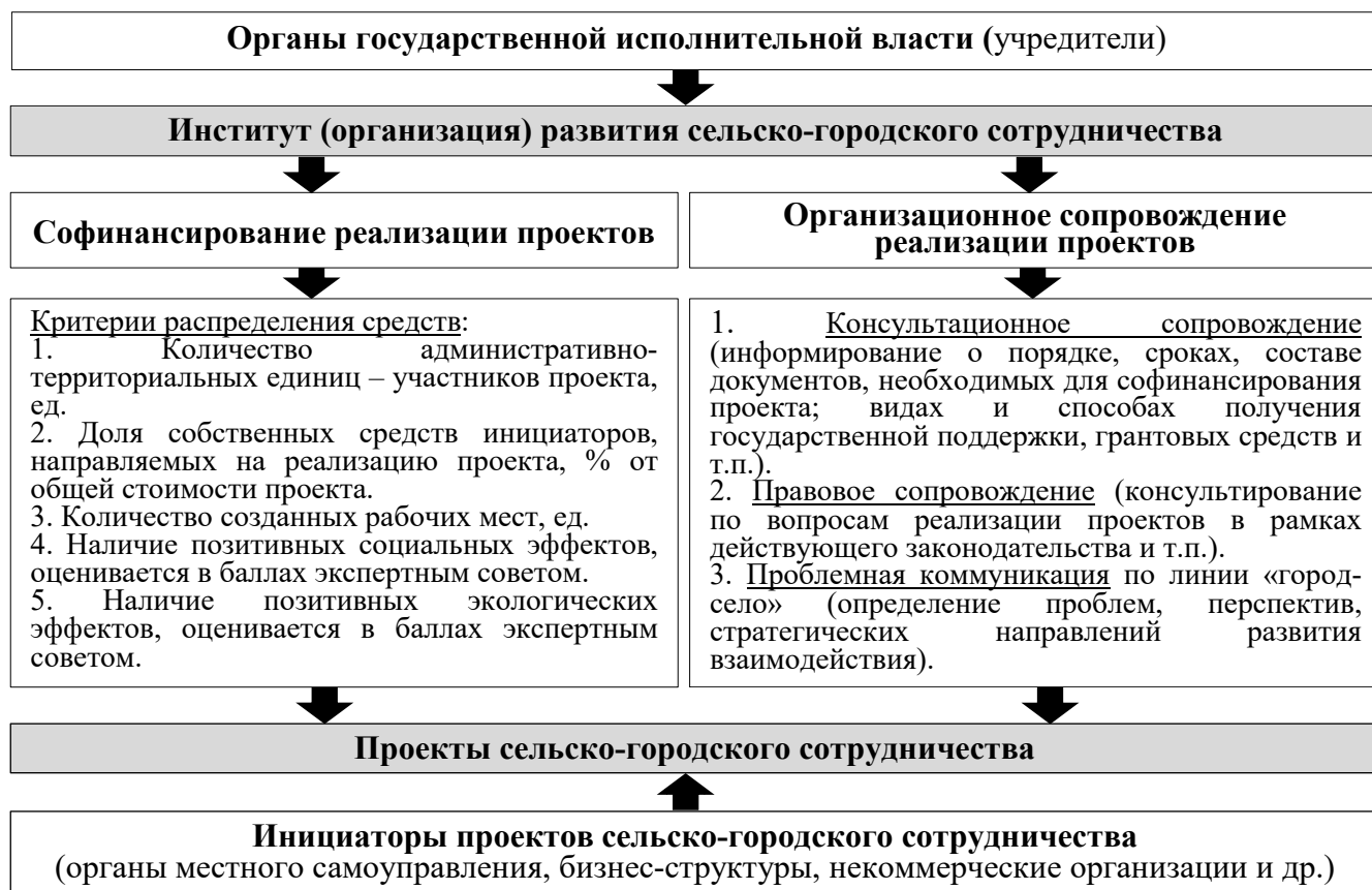
Рис. 2 – Схема функционирования института развития сельско-городского сотрудничества

ФГБУН ВолНЦ РАН) – обоснована целесообразность использования таких механизмов, как: 1) создание автономной некоммерческой организации или межмуниципального хозяйственного общества; 2) предоставление горизонтальных субсидий; 3) формирование института развития сельско-городского сотрудничества в форме организации, схема функционирования которого представлена автором на рис. 2.